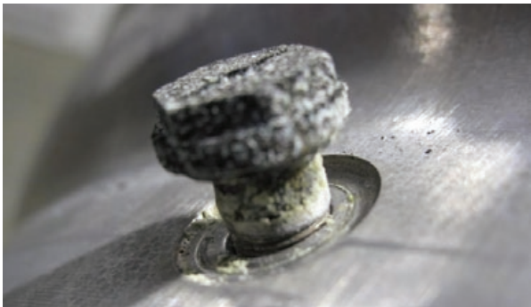
Oxidation beginnend unterhalb Mutter

Korrosion ist einer der Hauptgründe für Risse um das Ventil und das Ventilloch. Mit einigen einfachen und schnellen Wartungsmaßnahmen, kann diese Korrosion beseitigt werden.