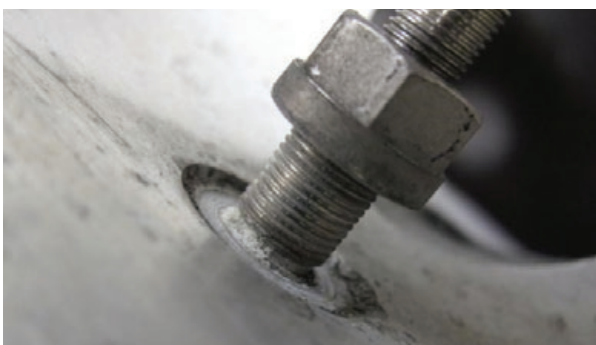
Oxidation auf T-Förmigen Dichtungsring